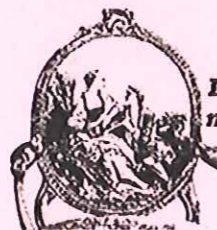
Dossier en médaillon